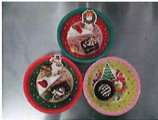
ショートケーキと チョコケーキ☆