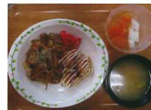
たこ焼き&焼きそば