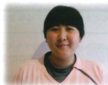
ショートステイ 北村

初めまして。4月から秋風3丁目に配属になりました。まだまだ分からない事がありますが、日々ご利用者様と安心、安全、安楽に過ごして頂ける様、頑張りたいと思います。宜しくお願いします。