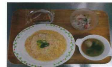
兵庫(蟹チャーハン)